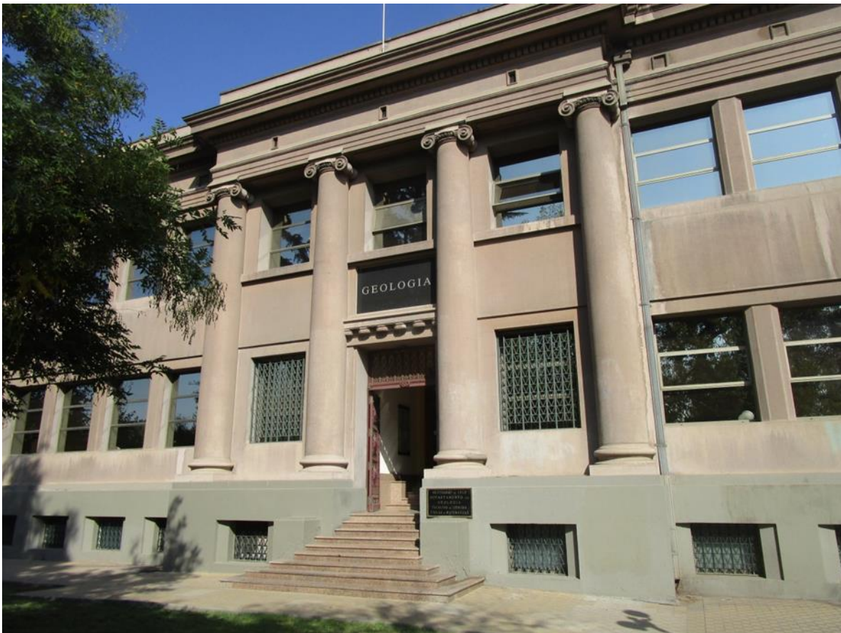
Edificio de la Escuela de Geología, Facultad de Ciencias Físicas y Matemáticas, Universidad de Chile, Plaza Ercilla 803.