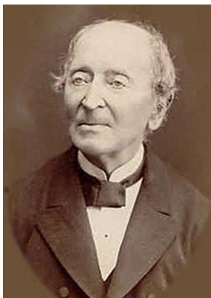
Ignacio Domeyko (1802-1889)

En 1843 y ya creada la Universidad de Chile, Ignacio Domeyko fue incluido entre los doce miembros académicos fundadores de la Facultad, donde pasó a ocupar el cargo de Secretario de Facultad, una responsabilidad comparable a la de Vice-Decano en la actualidad. En este cargo acompañó al ingeniero español Andrés Antonio de Gorbea (1843-1852) designado para asumir la primera decanatura de la Facultad (Lira, 1949). De esta forma y de la mano de Domeyko se echaron las bases de las ciencias y de la ingeniería en Chile. Posteriormente, Domeyko asumiría por tres períodos consecutivos, entre 1867 y 1883, el cargo de Rector de la Universidad de Chile, sucediendo, después del breve lapso que duró la rectoría de Manuel Antonio Tocornal (1866-1867), al ilustre venezolano Andrés Bello (1843-1865).